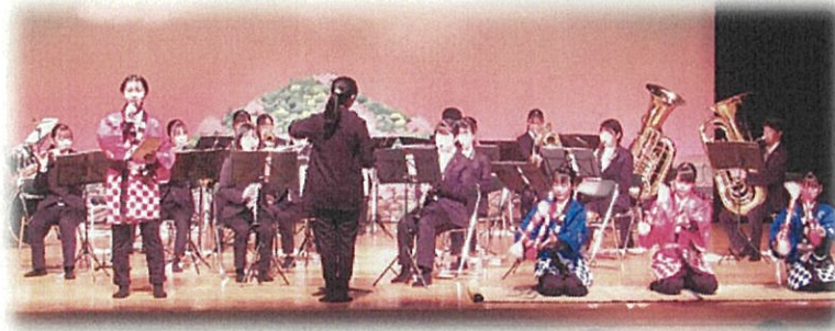
演奏だけでなく、歌あり！ダンスあり！銭太鼓あり！

11月に行われた「ボランティア講話」がご縁となり、NPO法人青少年サポートの会主催の『森の見た夢コンテスト』にて安来高校吹奏楽部がアトラクションとして参加させていただきました！ 2年ぶりの地域での発表の場となり、演奏する生徒たちは大興奮♪感謝の気持ちを込めて演奏した4曲は、参加者の方にもとても喜んでいただけました。 会場がひとつとなり、改めて音楽の力のすごさを実感しましたよ！