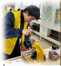
↑ 人権に関わるいろんなブース出展がありました。オリジナル缶バッジ・カレンダー作りコーナーでも安高生の活躍が光りました！