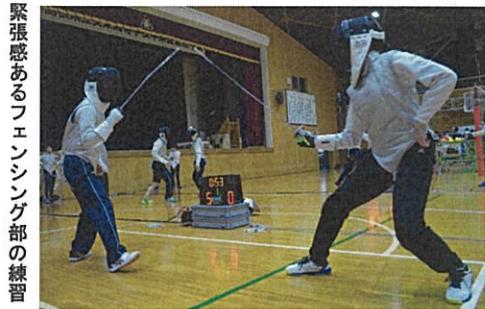
緊張感あるフェンシング部の練習

県総体では全ての種目と団体戦の出場枠を安高で埋めることを目標にしています。練習では個人の技術を高めるだけでなくチーム全体で良い雰囲気づくり